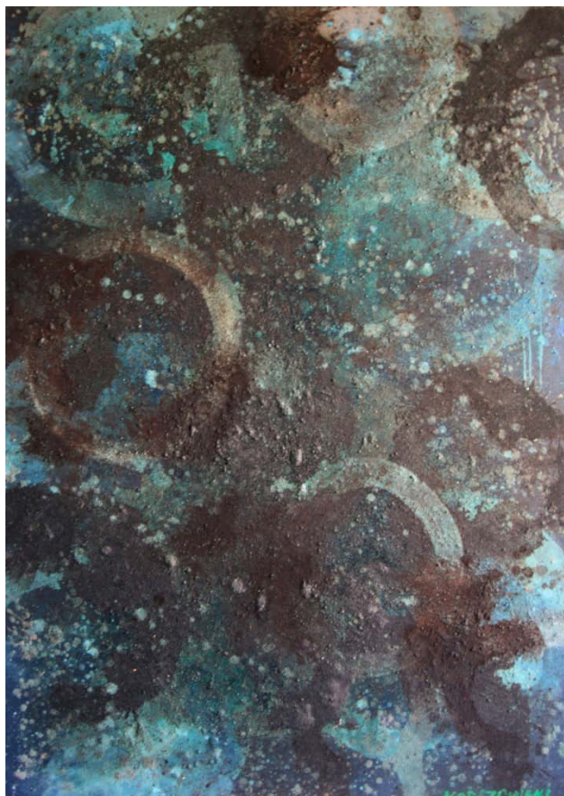
Orbium Coelestium, 2011 - olej / płótno (150 x 100 cm)

W czerwcu 1989 roku odbyła się monograficzna wystawa "Korczowski / Malarstwo" w Narodowej Galerii Zachęta w Warszawie. Ta wystawa była świadectwem, że mimo swojego debiutu jako performer oraz ogólnej tendencji sztuki współczesnej do eksperymentowania z nowymi technikami, Bogdan Korczowski pozostaje od początku wierny najbardziej tradycyjnej materii - malarstwu olejnemu. W 1998 roku Instytut Polski w Paryżu zorganizował retrospektywną wystawę artysty.