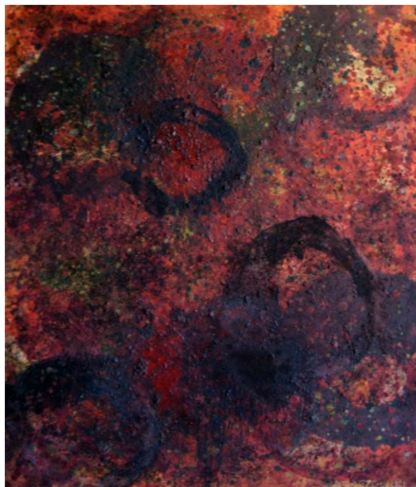
Orbium Coelestium, 2011 - olej / płótno (120 x 100 cm)

Poczynając od wczesnego cyklu obrazów "Listy", powstającego już od roku 1980, artysta umieszczał na swych płótnach wyolbrzymione symbole i ideogramy. Ta seria prac zatytułowana "Ecriture" jest rodzajem wymiany, czy "korespondencji" intelektualnej, traktującej "pisanie" jako obraz, temat nad którym artysta "obsesyjnie" pracuje już od dawna. W jego pracach bardzo często występują drobne znaki układające się, jak pismo, w równoległe rzędy, nałożone na właściwą kompozycję niczym przesłona.