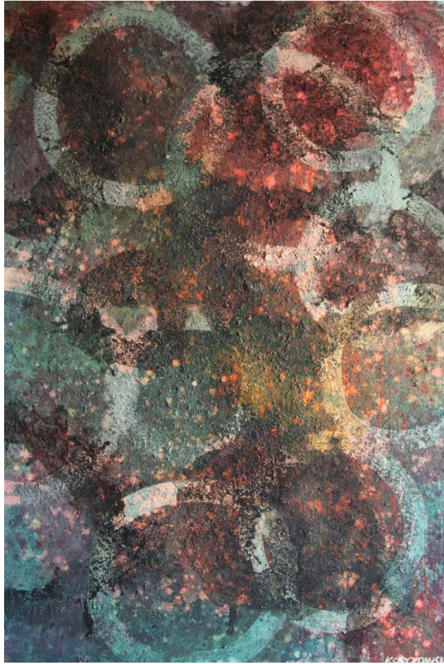
Orbium Coelestium, 2011 - olej / płótno (150 x 100 cm)