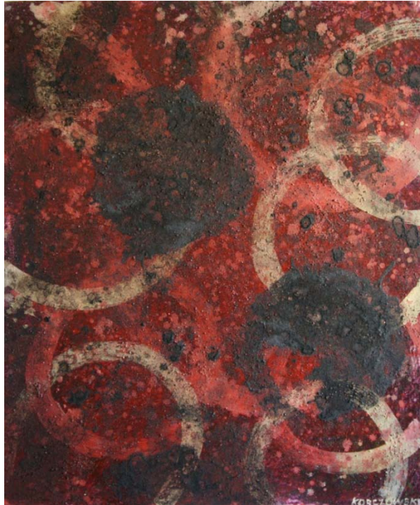
Orbium Coelestium, 2011 - olej / płótno (120 x 100 cm)

Poczynając od wczesnego cyklu obrazów "Listy", powstającego już od roku 1980, artysta umieszczał na swych płótnach wyolbrzymione symbole i ideogramy. Ta seria prac zatytułowana "Ecriture" jest rodzajem wymiany, czy "korespondencji" intelektualnej, traktującej "pisanie" jako obraz, temat nad którym artysta "obsesyjnie" pracuje już od dawna. W jego pracach bardzo często występują drobne znaki układające się, jak pismo, w równoległe rzędy, nałożone na właściwą kompozycję niczym przesłona.